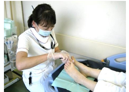
(フットケアの様子)