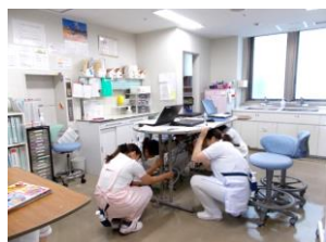
(シェイクアウト動作)