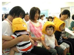
(患者様、院内保育園児の避難誘導)