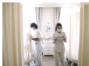
(被害状況、負傷者の確認)