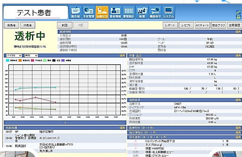
(フューチャーネット画面)