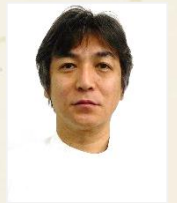
人工透析ひ尿器科 じんけいクリニック

当院に関わる全ての方々からの変わらぬご指導ご鞭撻を本年も賜りますよう、宜しくお願い致します。