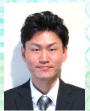
仁恵会本部事務長代行 兼 人工透析ひ尿器科 じんけいクリニック 事務長代行