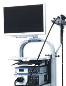
内視鏡ビデオスコープシステム「EVIS LUCERA ELITE」

また、上部消化管（経口・経鼻）、大腸の各スコープも従来に比べて細くなり、スムーズな挿入・操作が可能、検査・治療時の患者様への負担がより軽減されています。