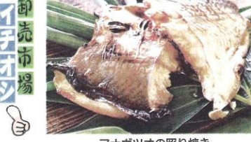
マナガツオの照り焼き

マナガツオと聞いて、わしません。瀬戸内産の魚の思い入れが深いマナガツオは、漁獲量も多く、食べ頃サイズのものが高値で取引されています。切り身、高級魚となっています。夏場には産卵のため浅瀬に集まってくるので、漁獲量も増え、お求めやすい価格になっています。 マナガツオは、西日本ではよく食べられていますが、東京ではあまり見ない魚です。マナガツオは、脂が豊富で、お目にかかると、お血がきれいになります。白身が柔らかく、お目にかかると、お血がきれいになります。白身が柔らかく、お目にかかると、お血がきれいになります。