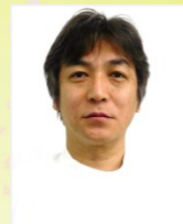
じんけいクリニック

本年も昨年の成果に慢心することなく、更なる直向きな努力、飽くなき挑戦、を続けていく所存ですので、患者さまや地域住民、近隣の諸先生方からの変わらぬご指導ご鞭撻を賜りますよう、宜しくお願い致します。