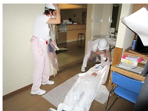
(病棟での訓練の様子 患者搬送・救急処置)