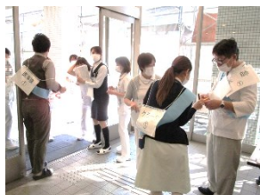
(外来での訓練の様子 トリアージ・救急処置)